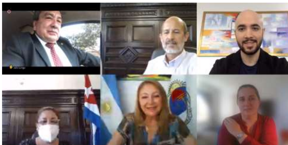
REUNION DE LACOMISION DE MEDIO AMBIENTE Y TURISMO

Se acordó crear un grupo de trabajo para la elaboración de un proyecto de ley sobre pérdidas y desperdicios de alimentos, y se aprobó el proyecto de Ley Modelo de Sistemas Comunitarios de Agua y Saneamiento .