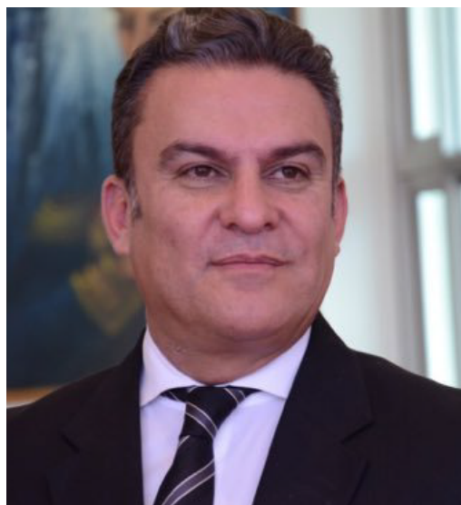
JOSÉ SERRANO PRESIDENTE DE LA ASAMBLEA NACIONAL